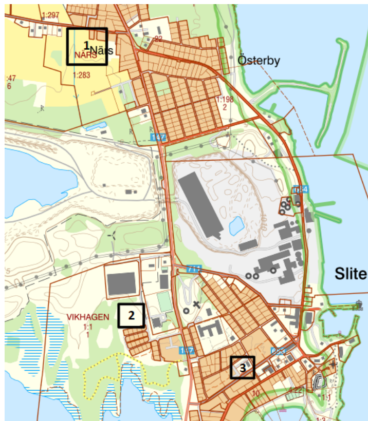
Översikt av områden som undersökts

Förstudien begränsades till att endast omfatta områden som tillhör tätorten Slite i Gotlands kommun. Inledningsvis i förstudien utreddes tre områden som ansågs intressanta för ändamålet: Othem Närs 1:283 (1), Othem Vikhagen 1:1 (2) och Othem Rapphönan 5 m.fl. (3). Se bild nedan.